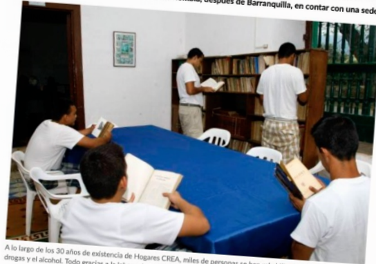
A lo largo de los 30 años de existencia de Hogares CREA, miles de personas se han rehabilitado de su adicción a las drogas y el alcohol. Todo gracias a la labor asistencial de esta entidad.

Bucaramanga fue la segunda ciudad de Colombia, después de Barranquilla, en contar con una sede de Hogares CREA.