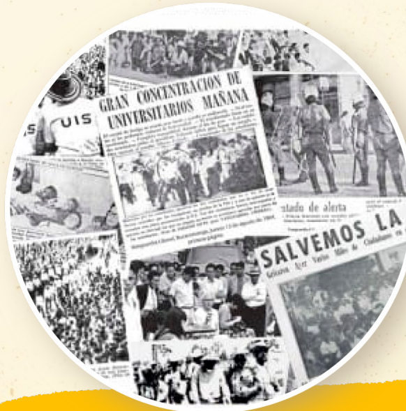
Santander es cuna del movimiento universitario.