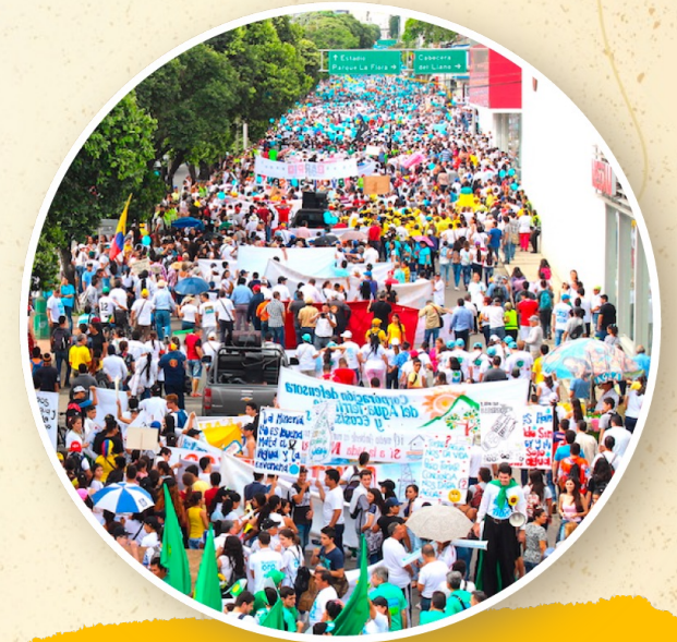
En Santander se movilizan los defensores del agua, de la familia, los trabajadores y la ciudadanía.