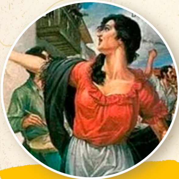
Levantamiento de los Comuneros de 1781.